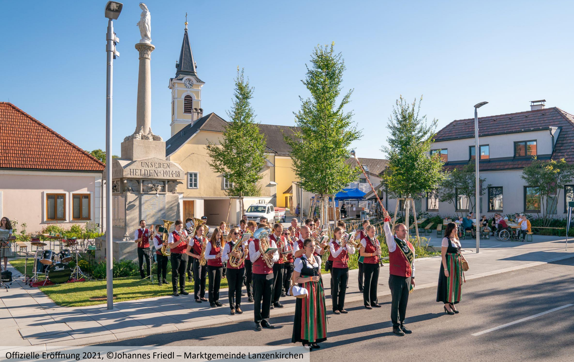
Offizielle Eröffnung 2021