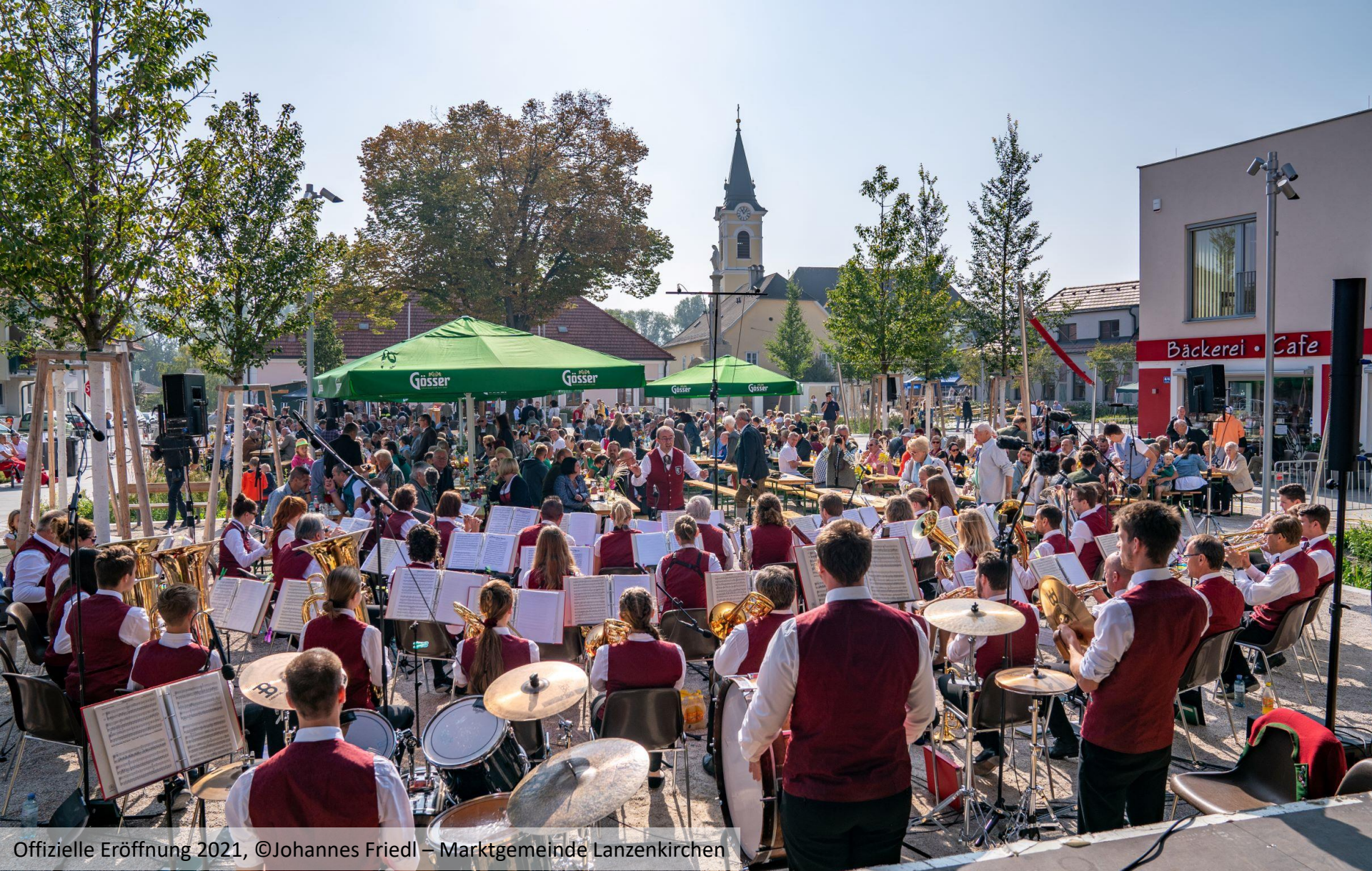
Offizielle Eröffnung 2021