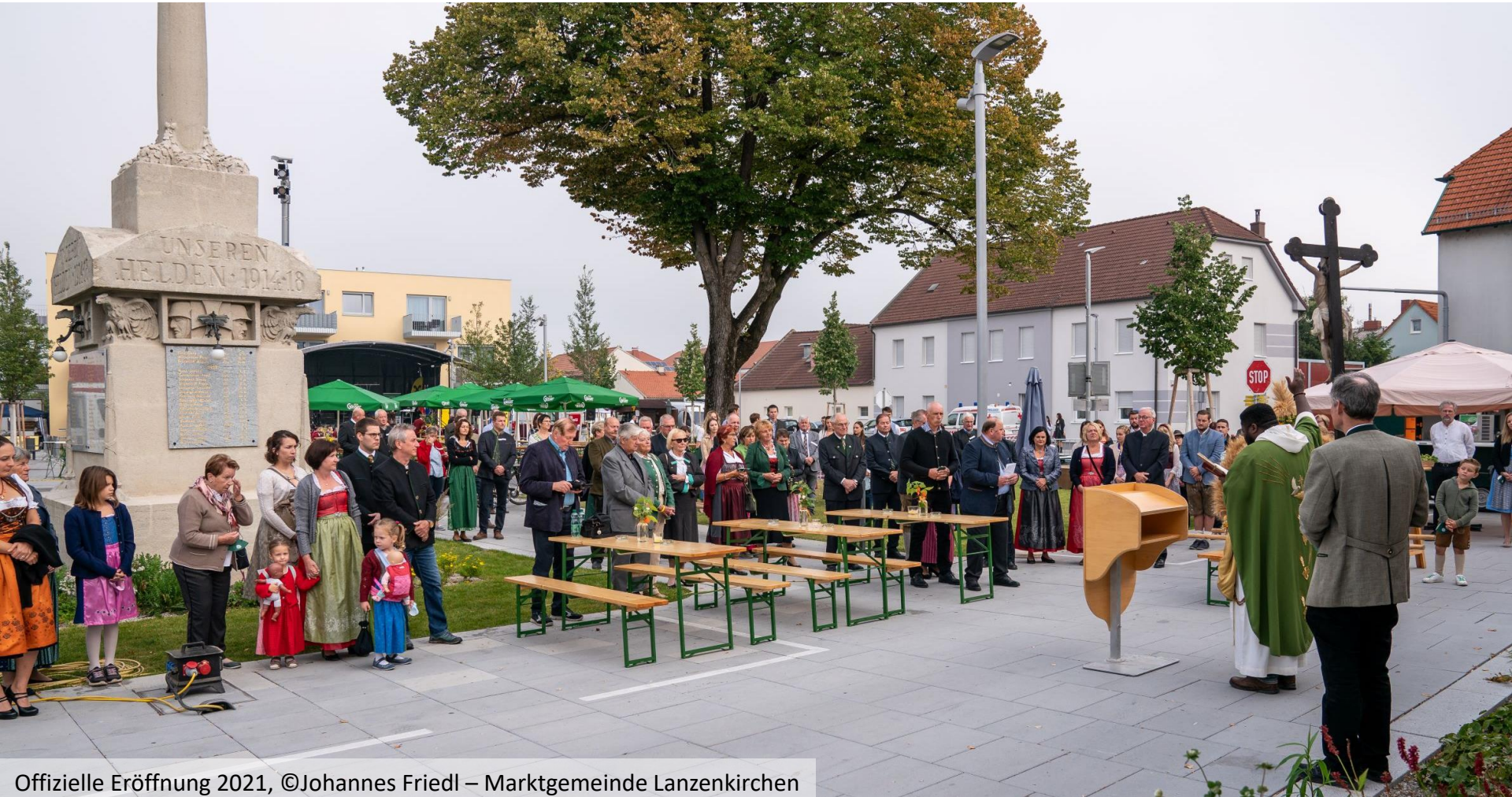
Offizielle Eröffnung 2021